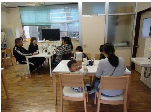
(多くの方が参加してくれました。)

四月十五日の『喫茶はやつき』の茶菓子は「はつきく大福」でした。もっちりした生地の中に自家製のアんことプリプリの八朔の実が一つゴロッと入っています。一口噛むと歯ごたえの良い八朔と程よい甘さのあんこが意外と良く合いとても美味しく話もはずみ賑やかに交流ができました。