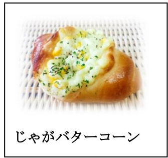
じゃがバターコーン