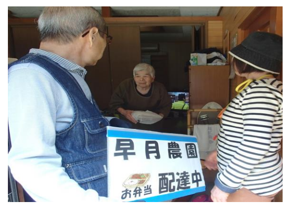
(こんにちは、お弁当です)

本年度新規事業は、早月農園では、今年度新たに果樹園2haを借り受けました。ヤマト福祉財団から500万円の助成金の交付が決定され、果樹園のモノレール整備並びに、ジャム等加工品製造の機器購入に充当し、生産活動収益の拡大と工賃向上を図ります。また、利用者増の対策としてオリーブ裏に計画している新建屋建設も農地転用等の手続きが終了後、事業化に向け取り組んでいく予定です。