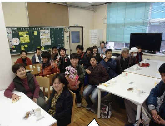
長い間、ありがとうございました！