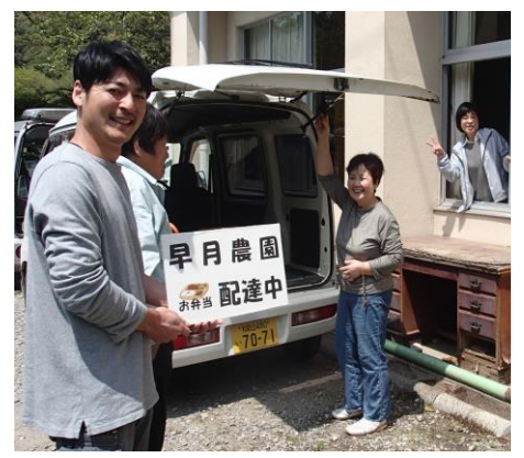
弁当配食サービス出発

他に「地域における公益的な取組(社会貢献)」が求められております。有田つくし福祉会として、有田川町早月地域の高齢者家庭への配食サービスを四月から実施しました。内容は、早月農園の給食施設で調理したお弁当を、高齢者家庭に金屋地区の民生委員の有志の方々にもお手伝い頂きお届けする取り組みです。当面は二ヶ月に一回の実施を予定しています。