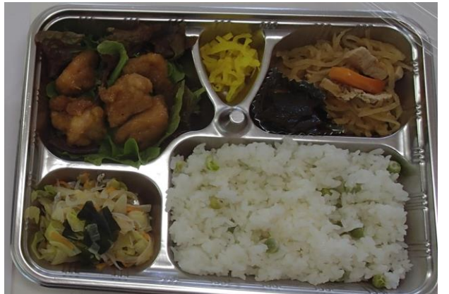
4月のお弁当 (豆ごはん、鶏肉のおれんじジュース煮ほか)