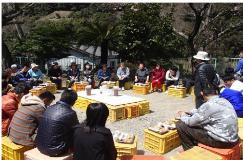
(お弁当、おいしかった。)

四月三日、入所式終了後、ぽかぽかと心地良い春の日差しの中、園庭の桜の下でお花見をしました。今年の桜はまだ三分咲き程でしたが、手作りの美味しいお弁当のおかげで会話もはずみ楽しいお花見となりました。お腹がいっぱいになった後は宝探しゲームと早月恒例のカラオケで盛り上がりました。新しい仲間も加わり賑やかに良い新年度のスタートとなりました。